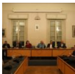
I nuovi programmi