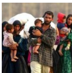
In arrivo altri 500 profughi. Parma