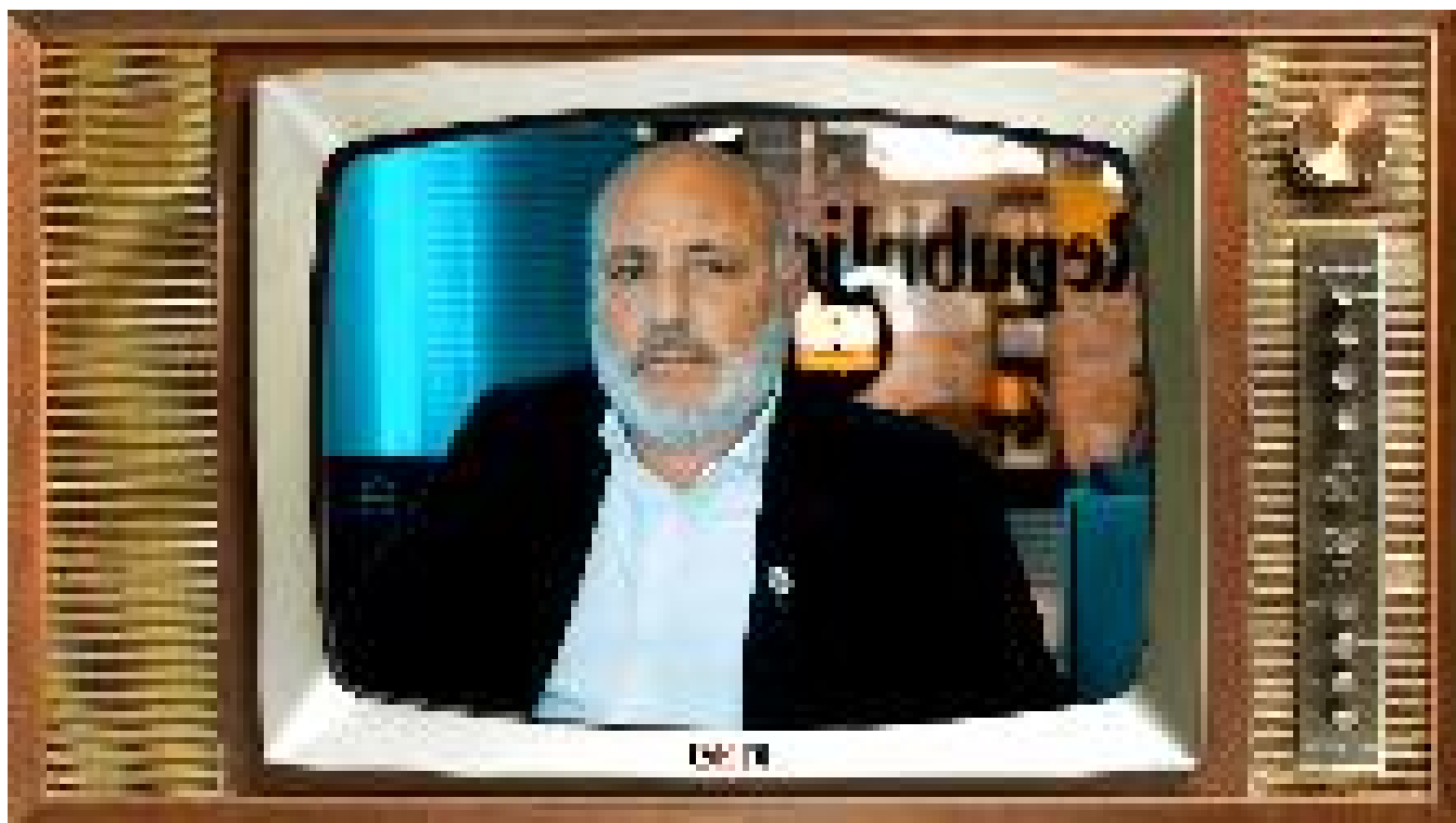
Metropolis/Files - "Gli asili traditi": perché il governo taglia i posti nido