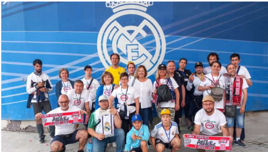
Squadra Paralimpica del Real Sala Baganza a Madrid in posa davanti allo stadio Santiago Bernabeu

Un sogno chiamato "Real" . Lo scorso giugno i ragazzi e le ragazze della squadra paralimpica del Real Sala Baganza sono stati per una settimana nella capitale spagnola ospiti del grande Real, quello di Madrid: hanno potuto visitare il