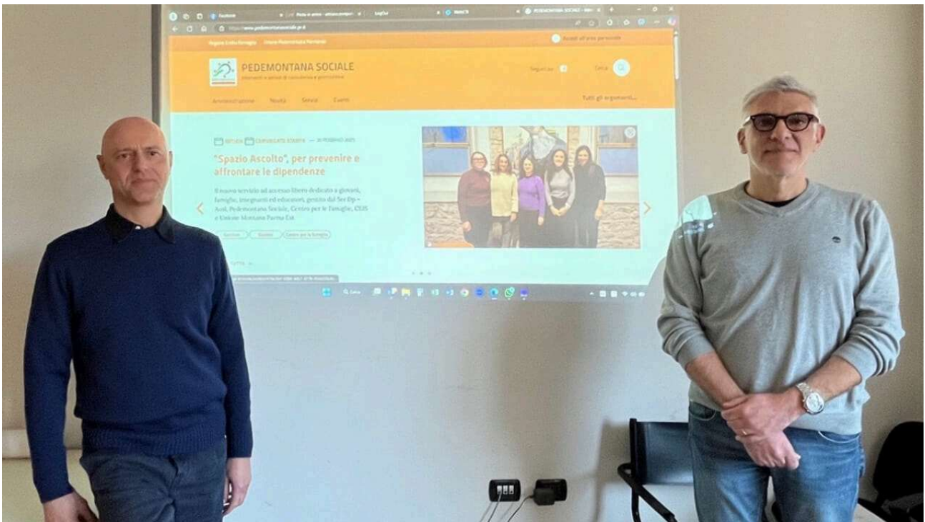
Un momento della presentazione del progetto

G li avvisi, le notizie, i progetti e i servizi, con tutte le informazioni e le modalità di accesso a portata di clic, con un sito dedicato. È online il nuovo portale di Pedemontana Sociale, raggiungibile all'indirizzo www.pedemontanasociale.pr.it , che permette ai cittadini dei cinque comuni dell'Unione Pedemontana Parmense (Collecchio, Felino, Montechiarugolo, Sala Baganza e Traversetolo) di conoscere in modo semplice e diretto tutte le opportunità e i progetti sul territorio a disposizione di anziani, minori, famiglie e, più in generale, delle persone in condizioni di fragilità.